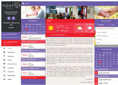
Tableau de bord

A l'ouverture de l'application, un tableau de bord résume l'ensemble des informations importantes dont le résident a besoin.